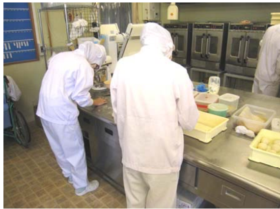
ぱんせいけいさぎよう ぱん成形作業