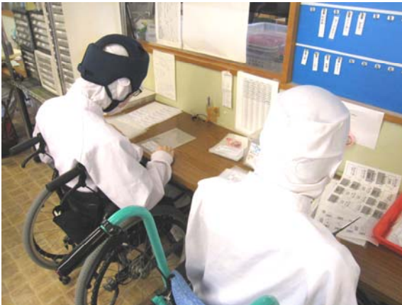
ぱん ふくろづ じゅんび ぱんの袋詰め準備