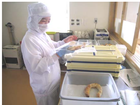
ぱん ふくろづ さぎよう ぱんの袋詰め作業