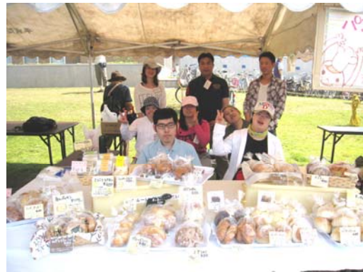
はんばいかいしまえ はい ちーず 販売開始前のハイ、チーズ！！