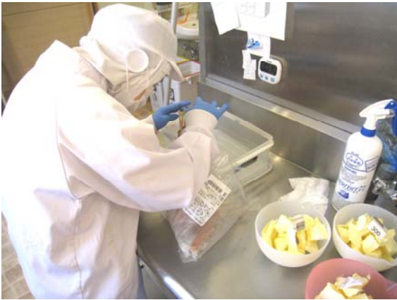
せいぞうざいりよう じゅんび 製造材料の準備

こんねんどみな せいちょう ばめん おお み ど、今年度皆さんが成長している場面が多く見られます。