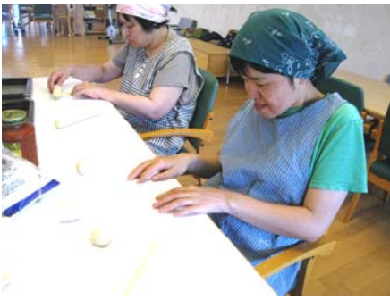
きじ こねこね 生地をコネコネ