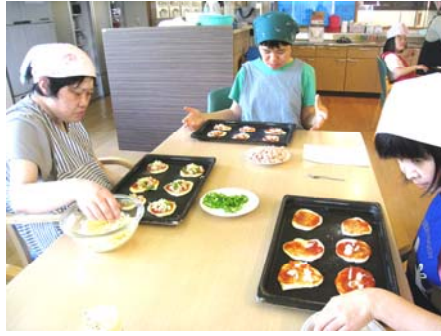
きれい もつ 綺麗に盛り付け