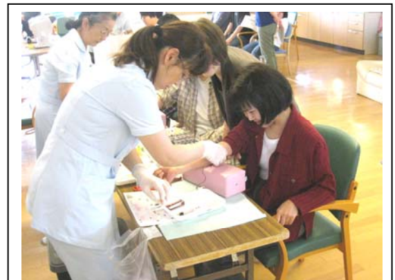
さいけつ ようす 採血の様子