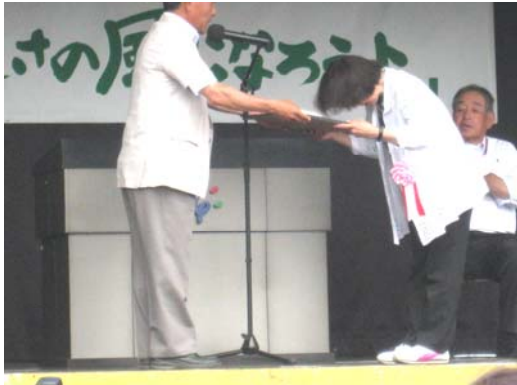
のーまらいぜーしょんしょう じゅうう うしろし ノーマライゼーション賞を受賞された後呂氏