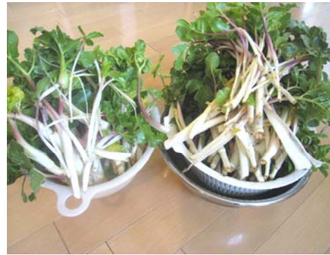
はまぼうふう ことし しゅうかく ハマボウフウは今年もたくさん収穫できました！