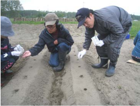
たね ちゅう つぶ ま 種まき中.. 3粒つつ蒔きましよう

はじ ちょうせん たま で き ば くさと おこな しゅうかく たの そだ 初めて挑戦する玉ねぎはどんな出来栄になるでしょうか？草取りをまめに 行き、収穫できるのを楽しみに育てたいで す。